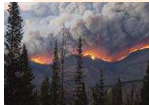
Incendio East Troublesome.

De las tres cosas que los incendios forestales necesitan para iniciarse y propagarse, los humanos no pueden cambiar ni el clima ni la topografía, es por eso que debemos concentrarnos en alterar los combustibles, para tener algún control sobre un disturbio tan dinámico como los incendios forestales. Los combustibles pueden incluir vegetación como árboles, maleza y pasto; pero cuando están cerca de las casas, los combustibles también incluyen tanques de propano, pilas de leña, cobertizos e incluso los mismos hogares.