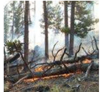
Colorado State Forest Service

La pinocha/agujas de pino y hojarasca que se encienden en cualquier lugar de una estructura o cercana a ella pueden causar daños y pérdidas.