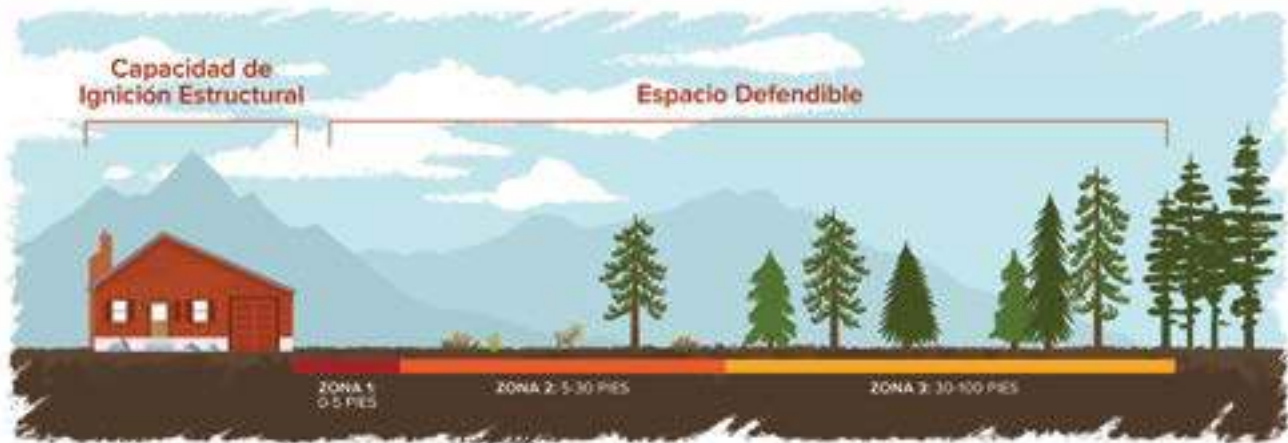
Ilustración: Bonnie Palmatory, Universidad Estatal de Colorado

es la casa y el área o estructura que la circunda. La HIZ toma en cuenta el potencial de la estructura para incendiarse como también la calidad del espacio defendible que la rodea.