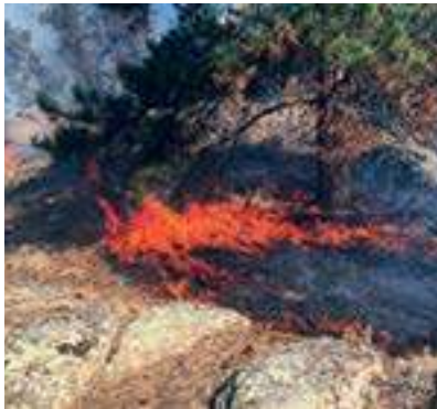
Colorado State Forest Service

Los pastos/hierbas son quizás el combustible de superficie más dominante y abundante en Colorado. Cuando las condiciones están dadas, los pastos/hierbas pueden encenderse fácilmente y estos incendios suelen propagarse de manera rápida. También se queman rápidamente y no liberan tanta energía como los incendios de combustibles más grandes, como los árboles. Sin embargo, los combustibles de pastizales pueden encender fácilmente las estructuras que están directamente adyacentes a ellos.