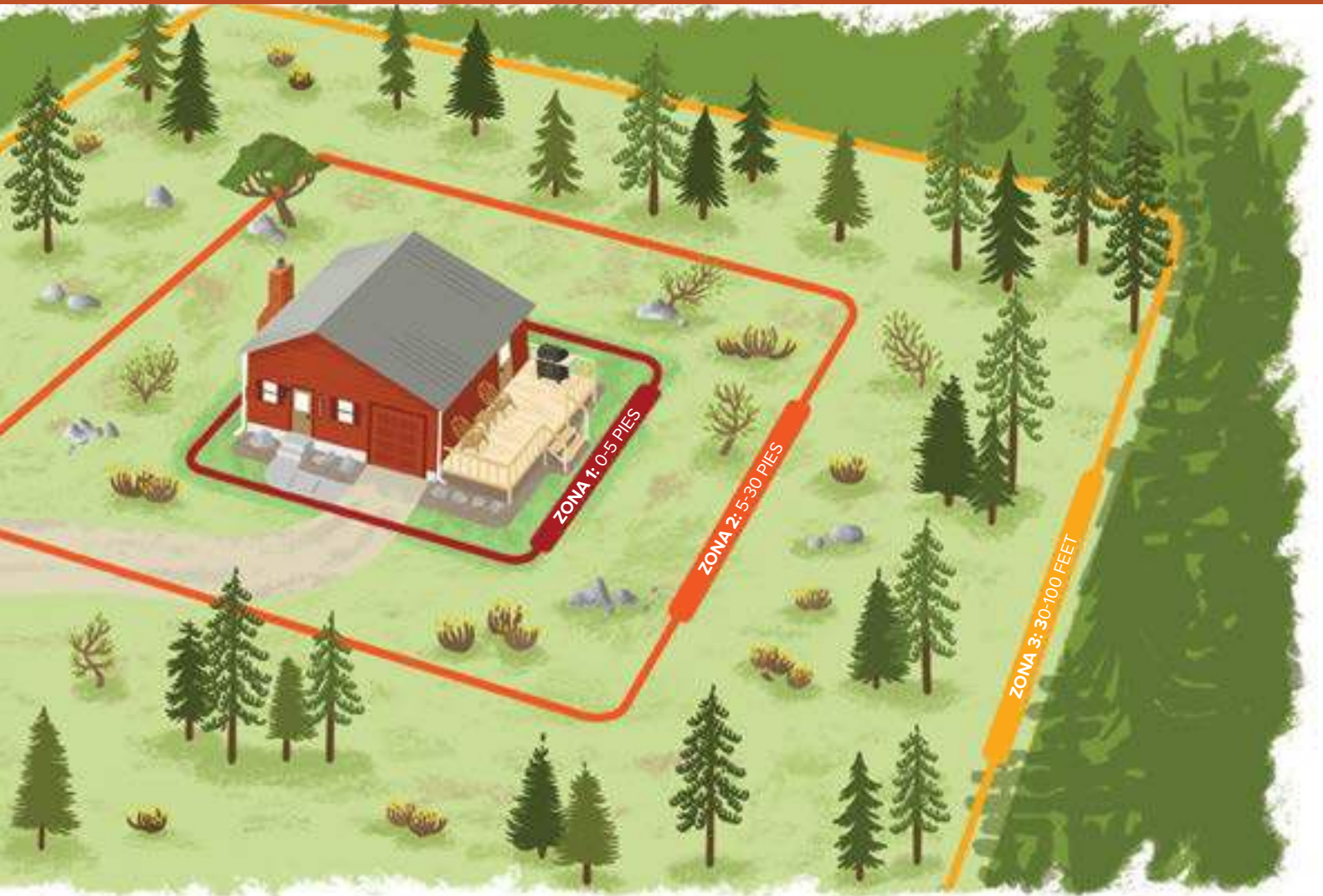
Ilustración: Bonnie Palmatory, Universidad Estatal de Colorado