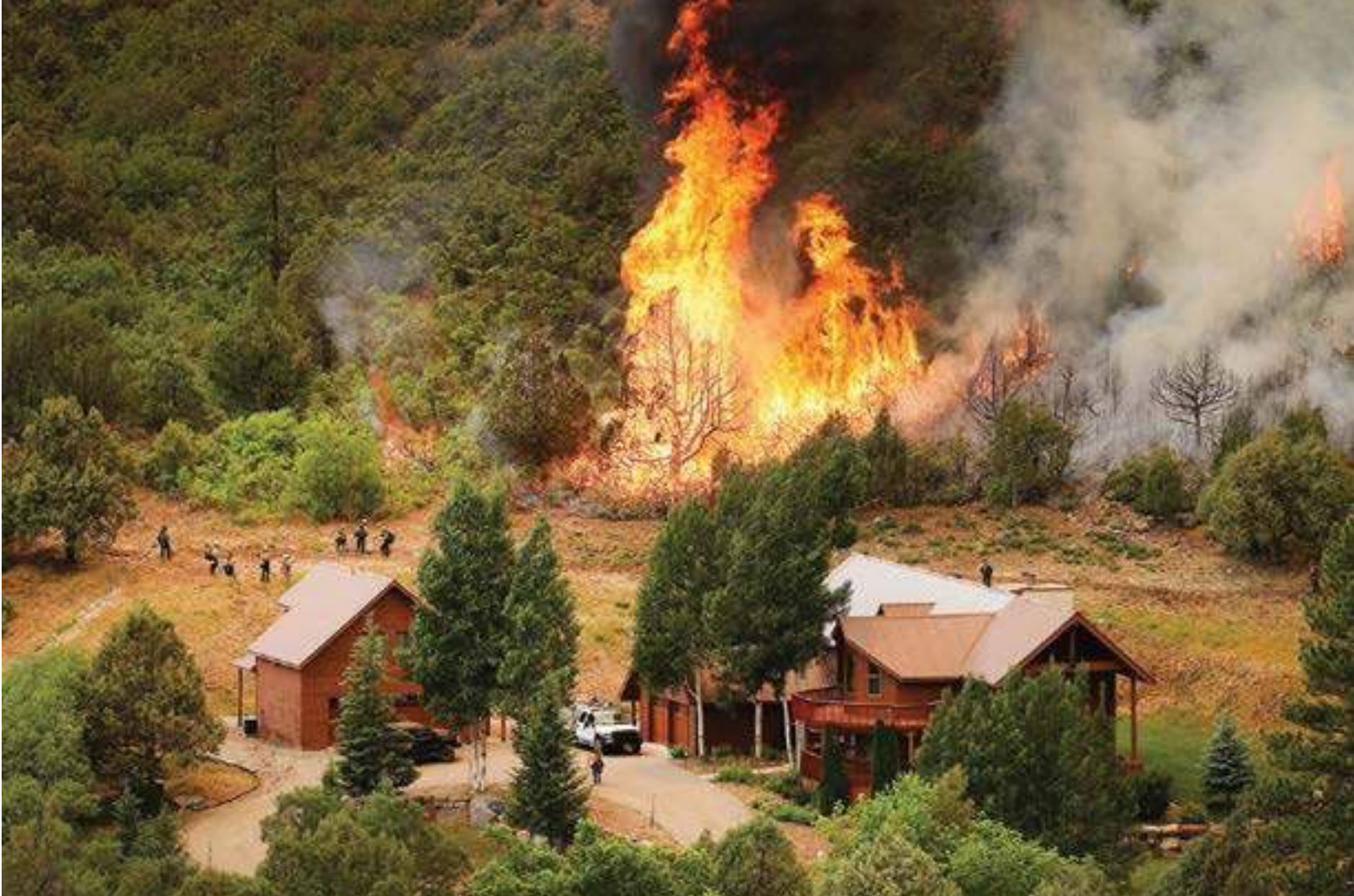
Mientras el Incendio 416 ardía cerca de Durango en 2018, los bomberos llevaron a cabo quemas controladas cerca de las casas, para eliminar combustibles naturales hacia el fuego existente y proporcionar una línea de control segura. El trabajo realizado por los propietarios para crear espacio defendible visible dio a los bomberos la opción de llevar a cabo la operación de forma segura.

La Estrategia Nacional Cohesiva de Gestión de Incendios Forestales (en inglés The National Cohesive Wildland Fire Management Strategy) define a una comunidad adaptada al fuego como “una comunidad humana conformada por ciudadanos informados y preparados que planifican y realizan acciones de manera colaborativa, para coexistir de manera segura con los incendios forestales.”