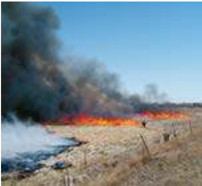
Colorado State Forest Service